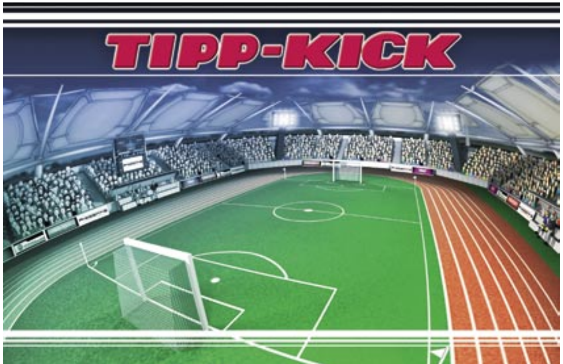
Tipp-Kick PC Cup: Das neueste Spiel von Procontis eignet sich nicht nur zum Überbrücken von Halbzeitpausen